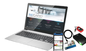
SECARD Kit de programmation SECARD et les protocoles SSCP® v1 & v2 et OSDP™

**Attention : informations sur les distances de communication : mesurées au centre de l'antenne, dépendant de la configuration de l'antenne, de l'environnement d'installation du lecteur, de la température, de la tension d'alimentation et du mode de lecture (sécurisé ou non). Des perturbations externes peuvent provoquer la diminution des distances de lecture. Mentions légales : STid, Architect® et SSCP® sont des marques déposées de STid SAS. Toutes les marques citées dans le présent document appartiennent à leurs propriétaires respectifs. Tous droits réservés – Ce document est l'entière propriété de STid. STid se réserve le droit, à tout moment et ce sans préavis, d'apporter des modifications sur le présent document et/ou d'arrêter la commercialisation de ses produits et services. Photographies non contractuelles