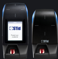
Disponible en version écran tactile ou standard