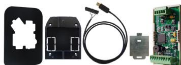
Plaque d'embellissement / Spacer / Câbles convertisseurs / Plaque de renfort...